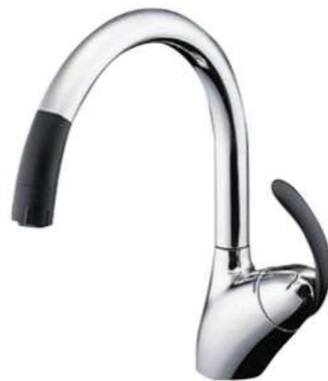
TOTO 台付シングル混合水栓 (グースネック) TKN34PBRA