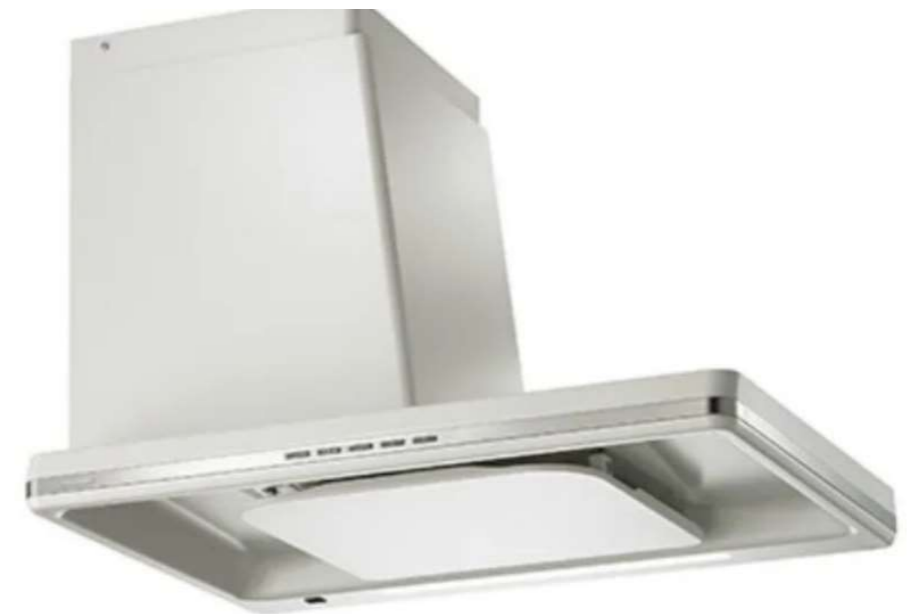
富士工業 サイドフード プレミアムプラス W900 SBLRL-EC-901R SI シルバー