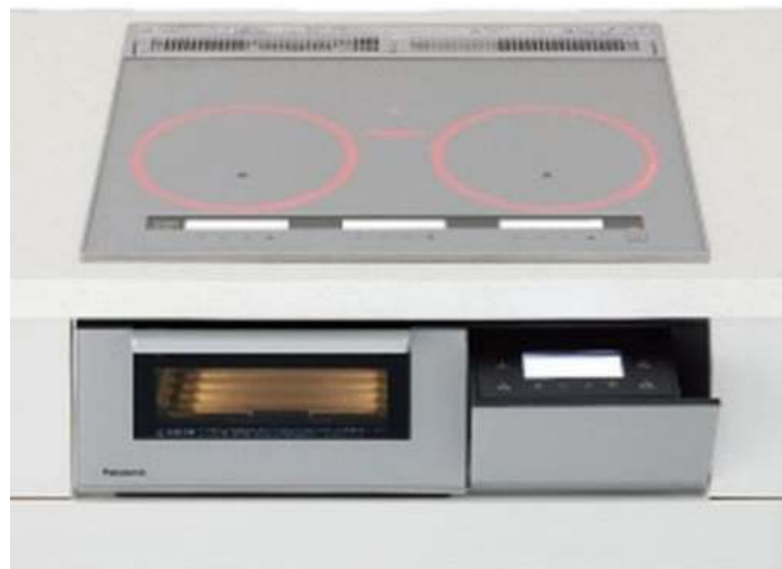
パナソニック IHクッキングヒーター W600 3口IH KZ-AN36S シルバー