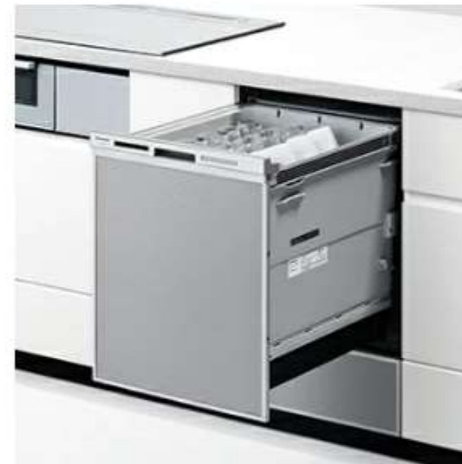
パナソニック 食器洗い乾燥機 ディーフタイプ NP-45MD9W