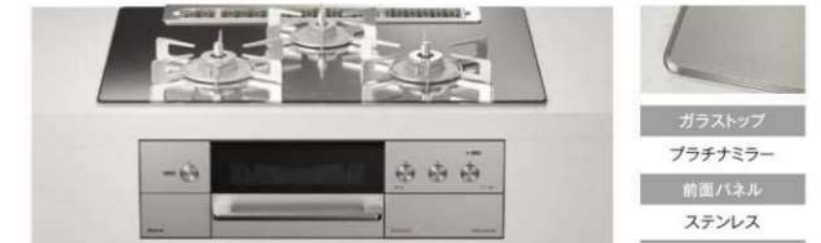
強火力 (左右) RHS71W31E13RCSTW (品名コード:52-0106) 希望小売価格 (税込) ¥368,500 (税抜¥335,000)