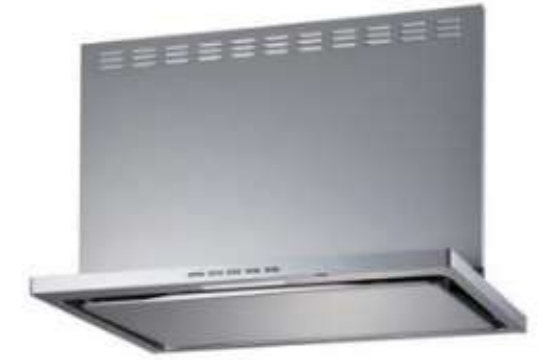
富士工業 レンジフード プレミアムプラス W900 LNRL-EC-901R SI シルバー