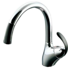
TOTO 台付シングル混合水栓 (グースネック) TKN34PBRA